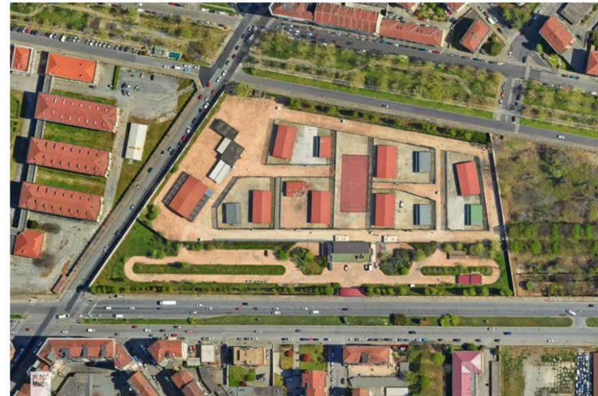
CPR di corso Brunelleschi a Torino 2024 CPR – Centri Per il Rimpatrio