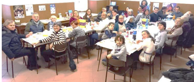
un momento dell'assemblea dell'AC interparrocchiale di Acqui