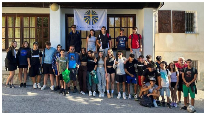
Casale – campo Giovannisimi