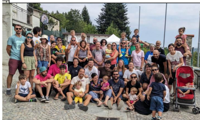
Mondovì – campo giovani famiglie e giovanissimi