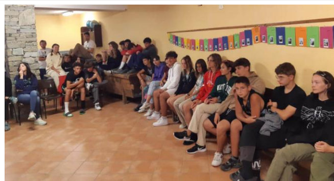
Susa – campo giovanissimi