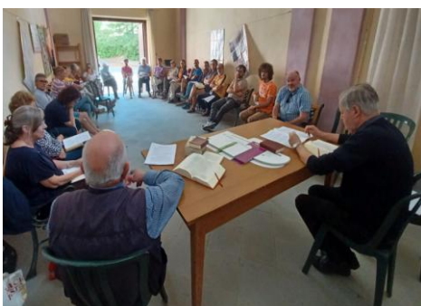
Acqui – campo biblico