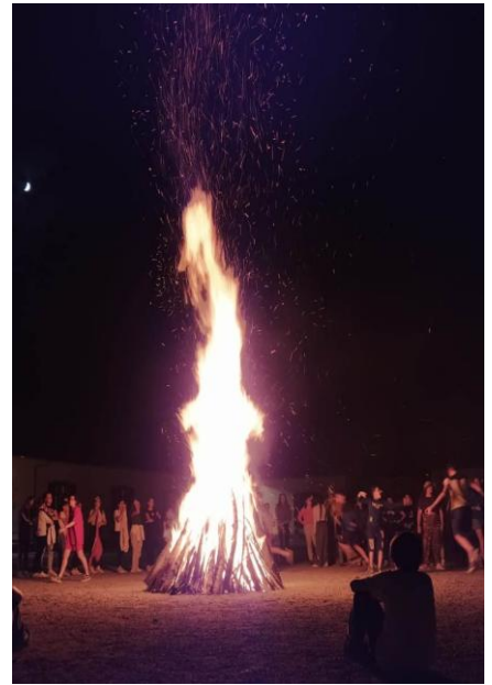
Mondovì – incontro adulti