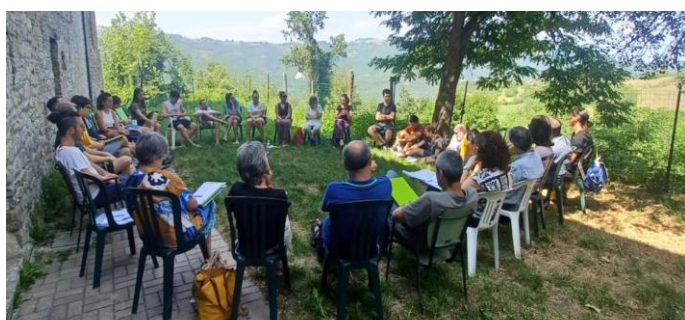
Acqui – campo responsabili