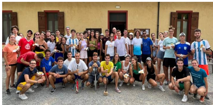
Fossano – campo giovani