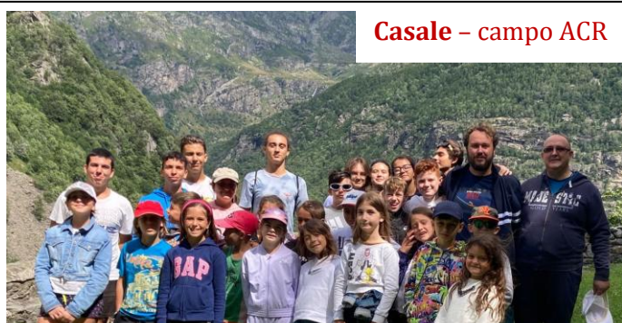
Casale – campo ACR