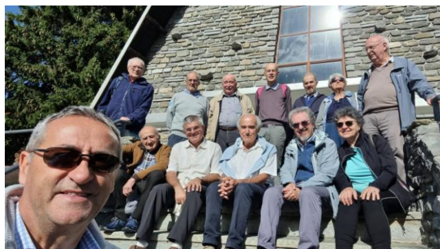
Pinerolo – incontro adulti