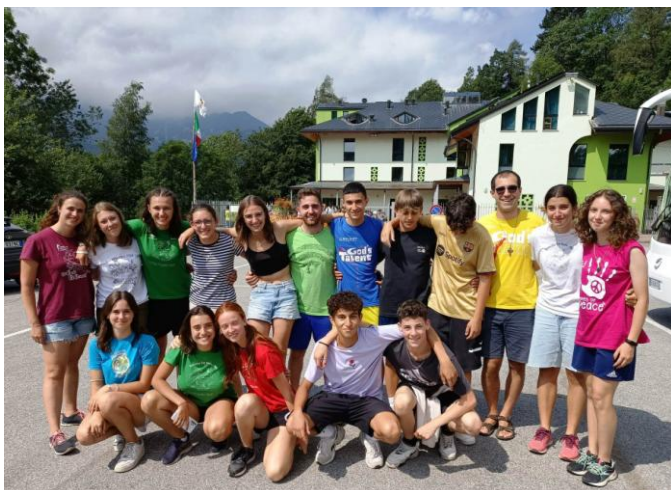
Asti – educatori e campo ACR