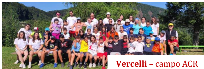
Vercelli – campo ACR

TEMPO DI INCONTRO E FORMAZIONE, PREGHIERA E DIALOGO