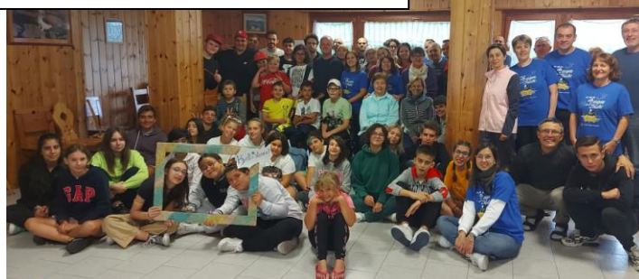
Alessandria – campo unitario

un consuntivo ancora provvisorio registra una bella ripresa dei campi estivi dell'AC: sono 12 le AC diocesane che quest'estate hanno organizzato campi formativi per ragazzi, giovani, adulti, responsabili, alcuni "speciali" (ecumenico, biblico). Oltre 60 appuntamenti che hanno coinvolto circa 3.700 partecipanti, con una preparazione impegnativa, sia per l'organizzazione sia per la formazione che ha coinvolto responsabili, animatori, referenti, assistenti. Un'esperienza significativa che guarda al futuro delle persone e della nostra comunità.