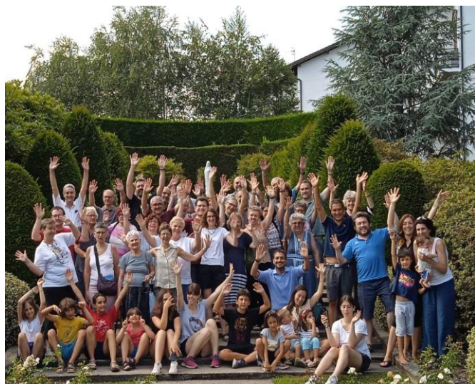
Torino – campo adulti famiglie