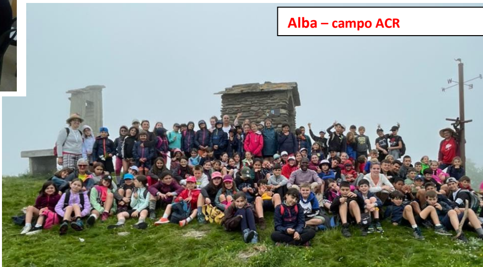
Alba – campo ACR