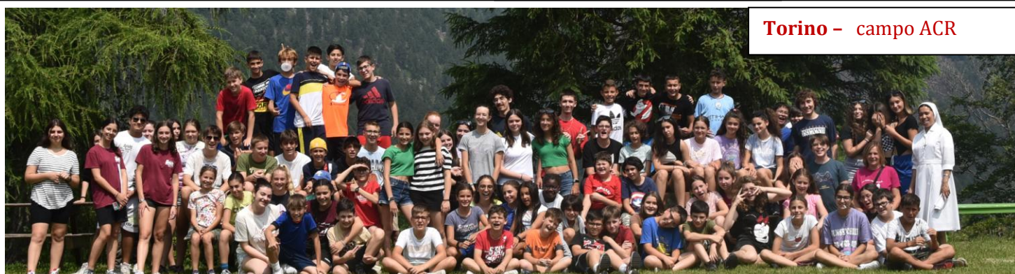
Torino – campo ACR